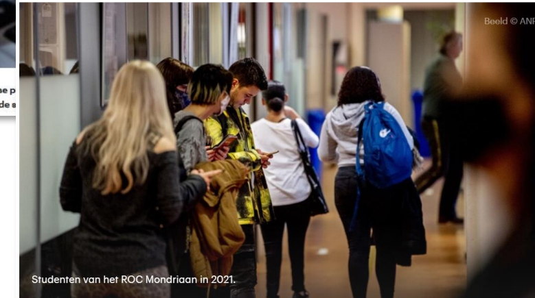
Studenten van het ROC Mondriaan in 2021.