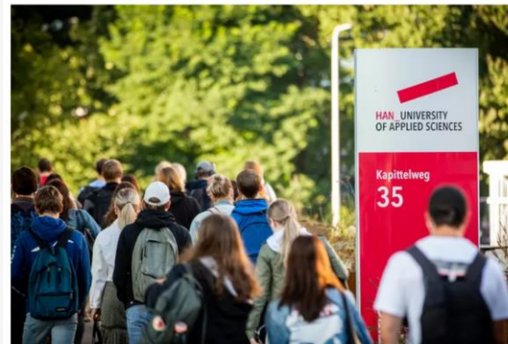
▲ Nijmeegse studenten van de HAN.