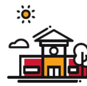
Samenwerking met school