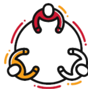
Samenwerking met SBB