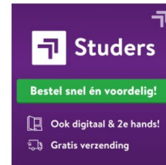
_12. Studers Studieboeken