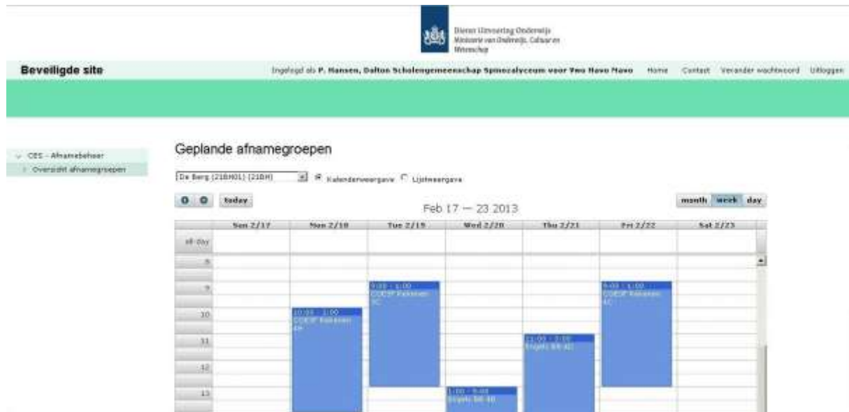
Fig. 1 Kalenderweergave voor planners in afnamebeheer

Voor mbo-instellingen is het mogelijk om reeds gemaakte afnamegroepen uit een roosterpakket via een bestandsuitwisseling te importeren in Facet.